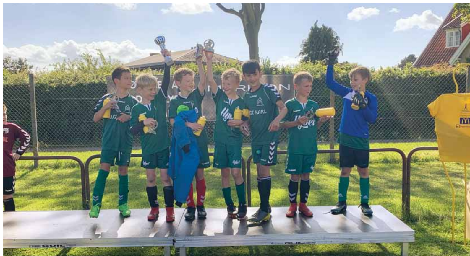
Et af vores fire U9 hold med pokaler fra Makron cup i Juni.