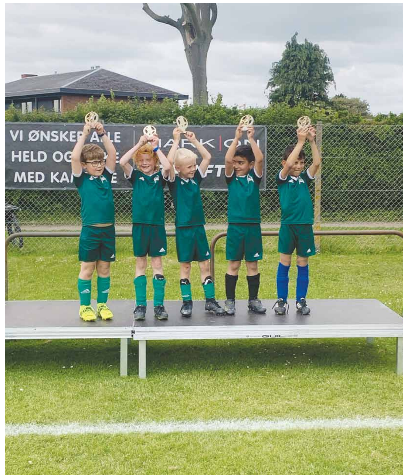
Selvom man går i 0. klasse (U6) - kan man godt levere en 1. klasses turneringspræstation.