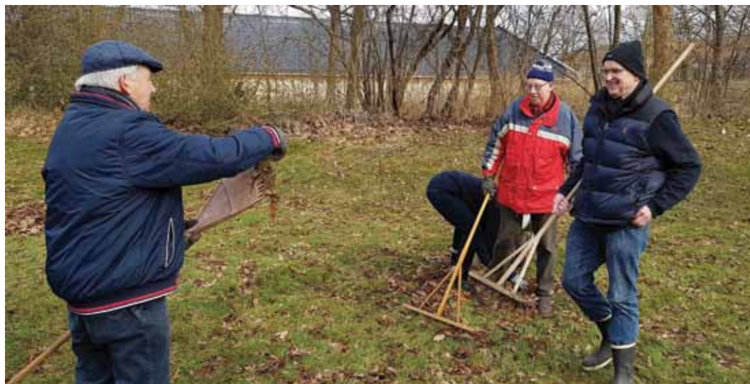
Krolfbanerne syd for tst-aktiv-centret er klargjort til sæsonåbning.

Her håber vi på at se alle de gamle medlemmer, såvel som nye.