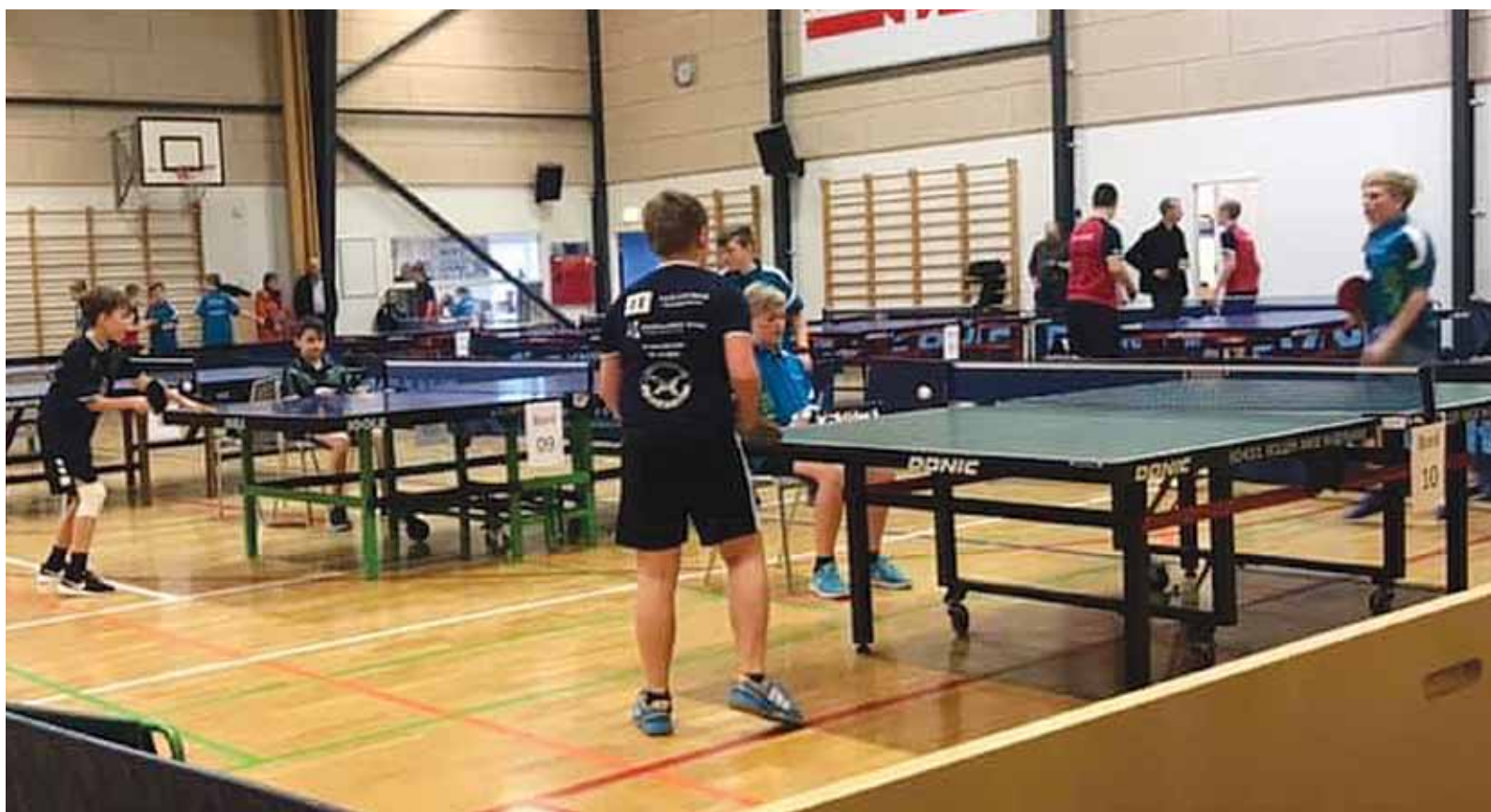
Yngre drenge i kamp.

Det har været endnu en god sæson i tst Bordtennis, hvor bolden har hoppet over nettet i utallige timer for både store og små, og hvor der er spillet masser af kampe til både stævner som holdkampe. Vi er mange spillere i både ungdom og senior, faktisk så mange at det kniber med pladsen til træning, når der om torsdagen også afvikles holdkampe.