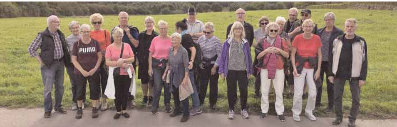
Deltagerne på første gåtur – udsigt over True Bakke.

tst-senioridræt støtter op om initiativet fra Aarhus Kommune, DGI og DAL i konceptet "Bevæg dig for livet", hvor der året rundt tages nye initiativer til aktiviteter med det mål bl.a. at få endnu flere +60 til at dyrke motion.