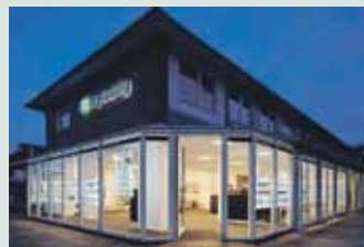
Nybolig Galten - Skovby Tlf. 8694 484

*Kilde: Samlet salg for kæder med mæglerforretninger i 8220, 8230, 8381 samt 8464 i perioden 24/8-17-24/8-18 jf. boligsiden.dk