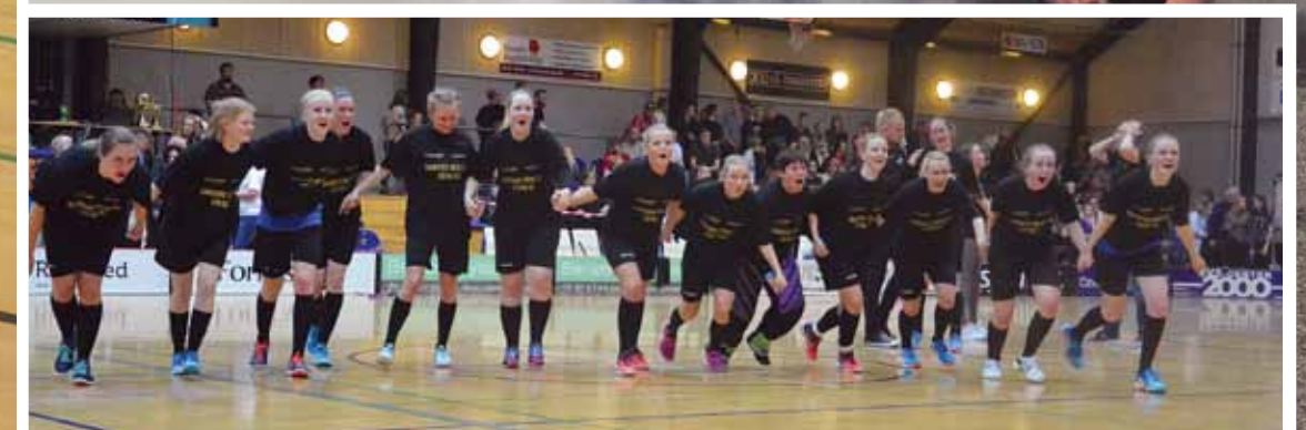
Holdet siger tak til de 50 medrejsende tilskuere.