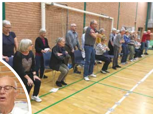
Kondi-test på stol ... op/ned mange gange.