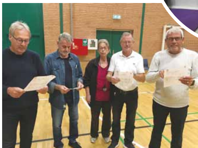
Resultat af KONDI-test nærlæses.