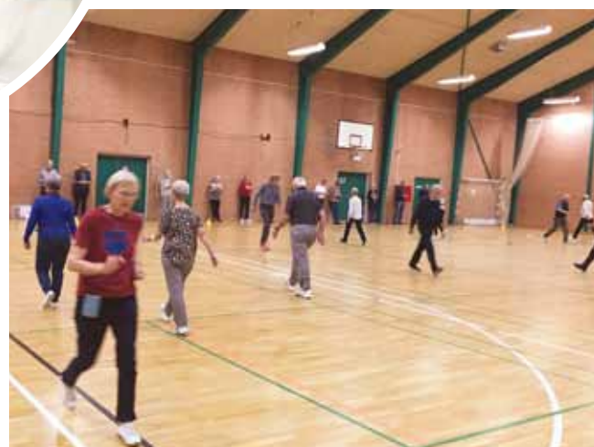
Konditest – rask gåtur.